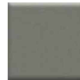
Gris / Grey