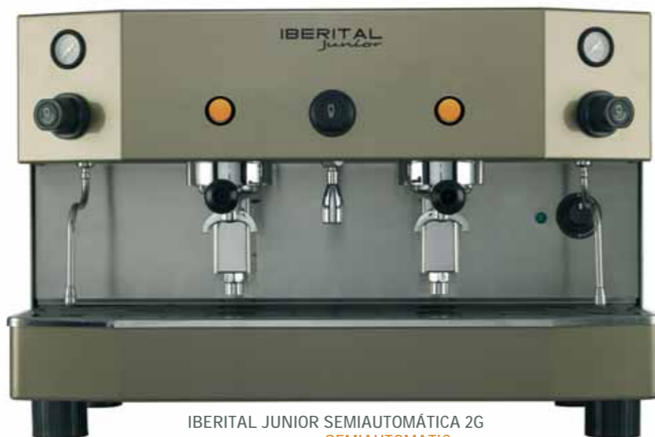
IBERITAL JUNIOR SEMIAUTOMÁTICA 2G SEMIAUTOMATIC