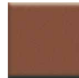
Cobre / Copper