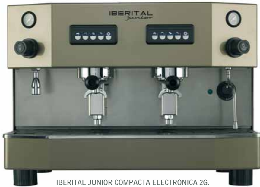
IBERITAL JUNIOR COMPACTA ELECTRÓNICA 2G. ELECTRONIC