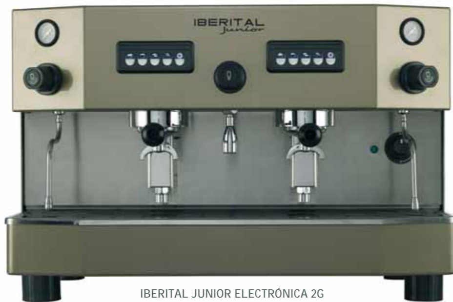
IBERITAL JUNIOR ELECTRÓNICA 2G ELECTRONIC