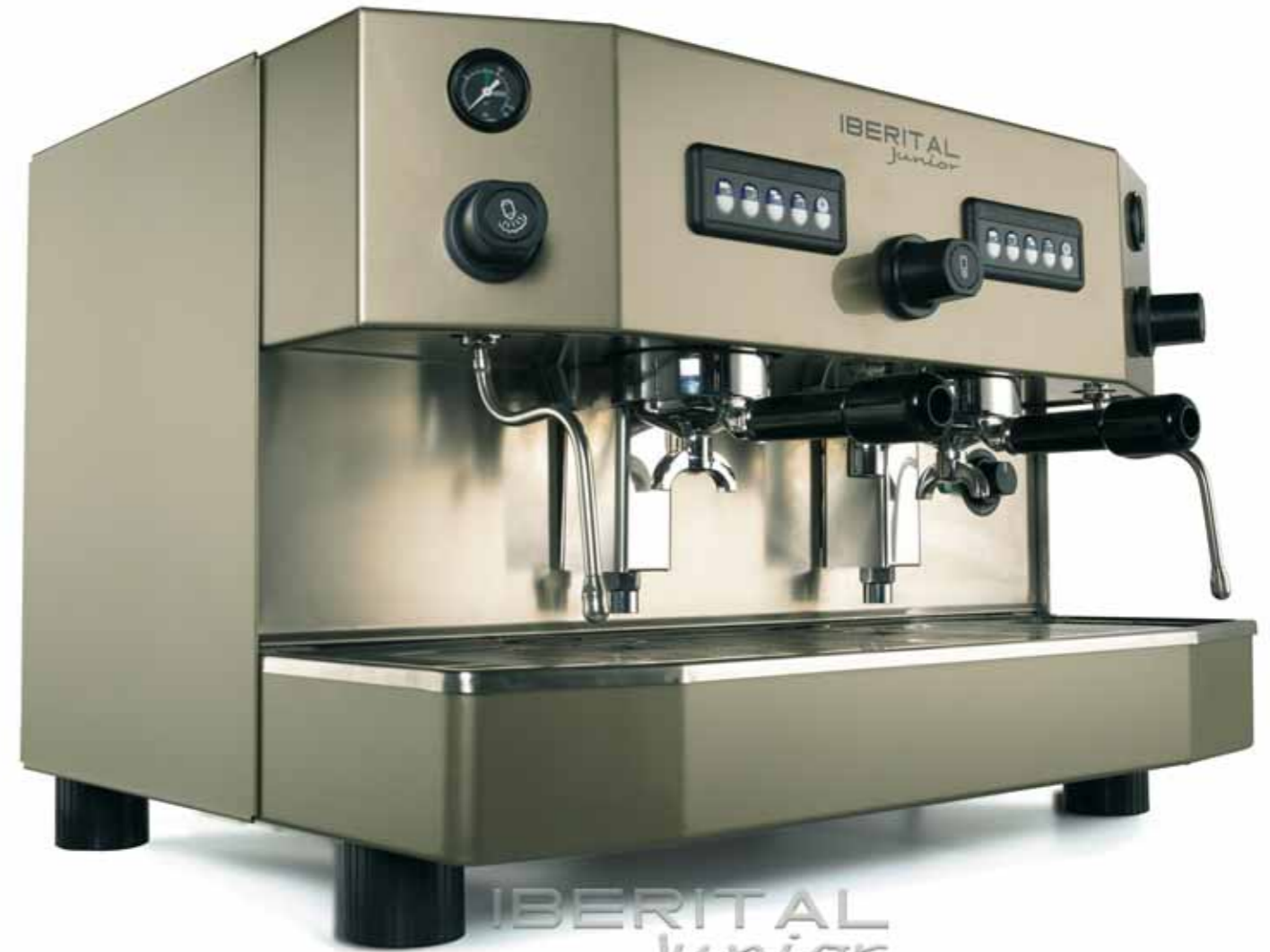
IBERITAL Junior ESPRESSO COFFEE MACHINE